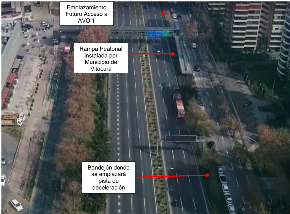
Imagen 2: Imagen donde se aprecia sector de emplazamiento de pista de deceleración e interferencia con obras existentes